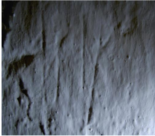
Fig. 2. Ristningen i den östra smygen till koringången. Foto M. Källström 2011.

En annan ristning finns sydsidan av det norra anfanget till den västra portalen i kyrkan, 130 cm ovanför golvet, under en målad djurfigur. Ristningen består av ett 10-tal ca 12 cm höga lodräta streck. Vissa erinrar om runor (bl.a. k ), men den kan knappast karakteriseras som en runinskrift.