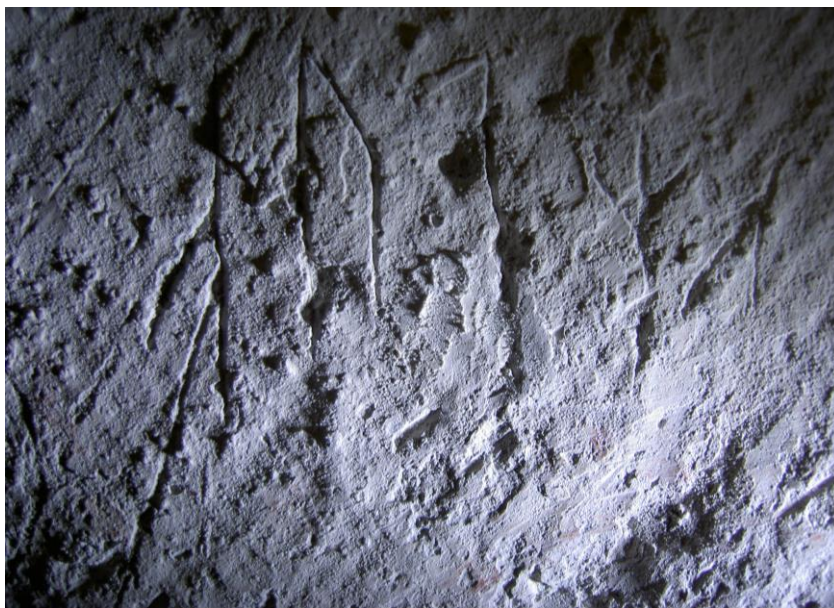
Fig. 1. Inskriften på nordväggen.

Runorna är ristade i korets norra innervägg ovanför korbänken, 73 cm Ö om korportalen och 20 cm ovanför den nisch som finns i nordväggen. Avståndet till trägolvet i korbänken är 143 cm. Ristningen är 5,5 cm lång och består av 1,5–3,3 cm höga runor.